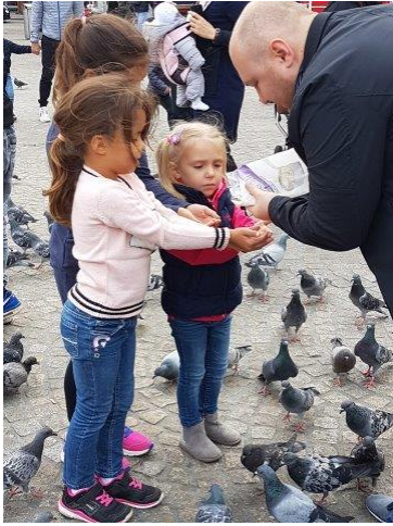
Foto: Jong en oud samen op de Dam

Eén van de uitdagingen waarvoor we in 2018 staan is de vraag of we het gesprek tussen de generaties weten te voeren.